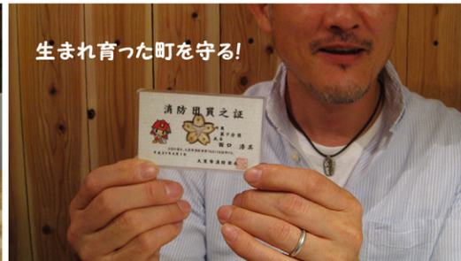
生まれ育った町を守る!