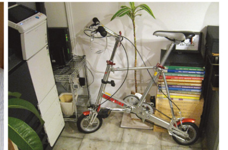
事務所もコンパクトなら 自転車も超コンパクト!!